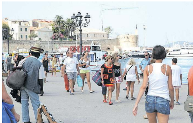
Alcuni turisti stranieri in visita ad Alghero

Lo studio della Cna rivela gusti e preferenze di chi viene dall'estero in vacanza. Spendono 910 euro a testa, restano 10 giorni. Il 50% va via per l'alloggio